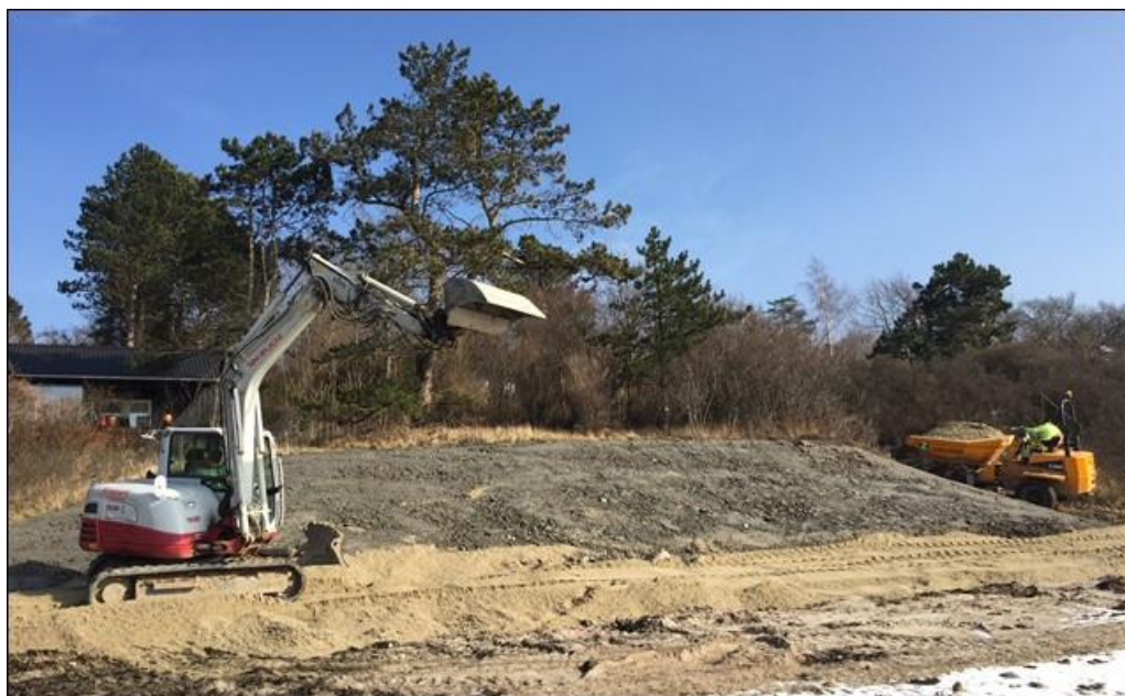
Figur 2: Foto fra marts 2018, der viser området med kystsikringen inden sandpåfyldning.

Efter dialog med og tilladelse fra Kystdirektoratet blev der primo 2018 gennemført kystbeskyttelse på sommerhusgrunden i form af en retablering af den ca. 3 m høje moræneskrænt med komprimeret ler, der hvor skrænten var eroderet på grunden under de sidste stormhændelser (Figur 2). Af hensyn til det visuelle indtryk og for at sikre, at kystdynamiske processer fortsat kan finde sted, blev lerskrænten efterfølgende dækket af en sandbuffer (Figur 3).