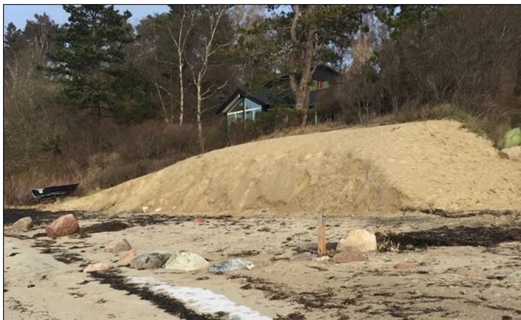
Figur 4: Foto fra januar 2019, der viser den oprindelige store sandbuffer efter erosion fra højvande. Foto fra samme vinkel som Figur 1.