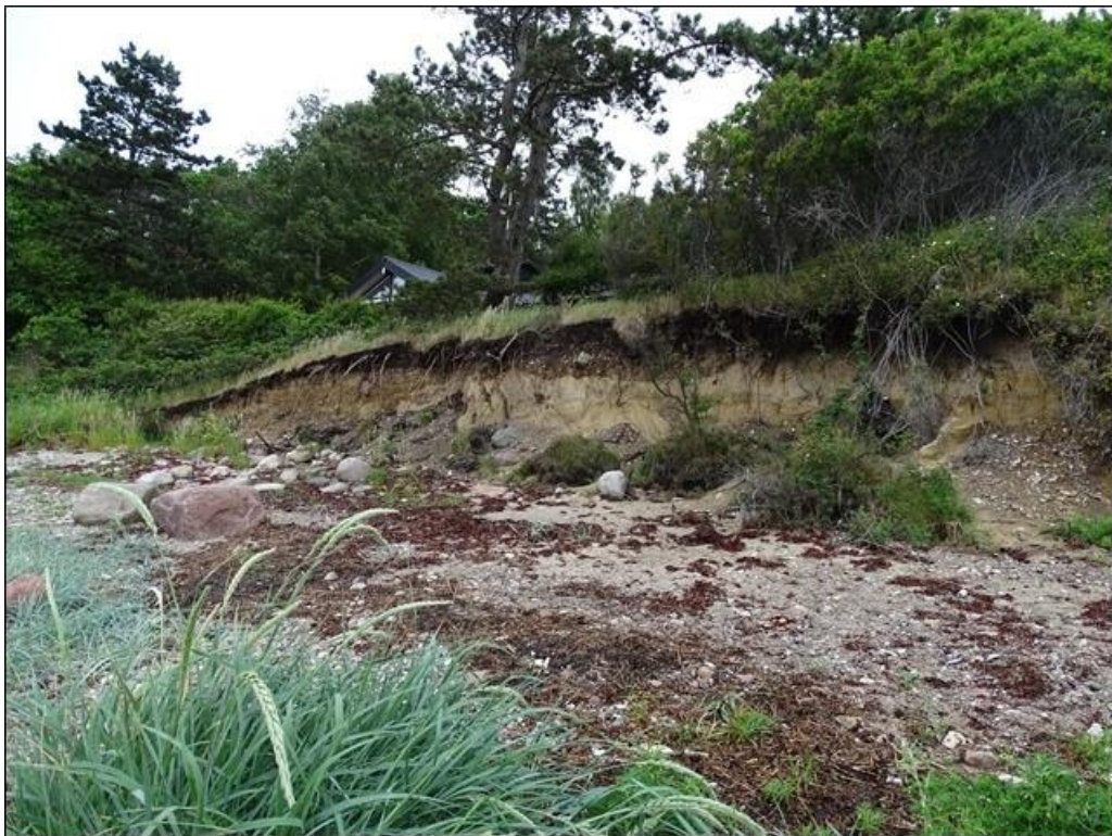
Figur 1: Foto fra 2017, der viser den eroderede skrænt set fra nord.

Ejendommen oplevede bl.a. under stormen Bodil i december 2013 og under stormen Urd i december 2016 en kraftig erosion, idet skrænten og den tilhørende beplantning forsvandt i fjorden, og nedstyrtningsfaren for ejerens bolig blev markant øget (Figur 1).