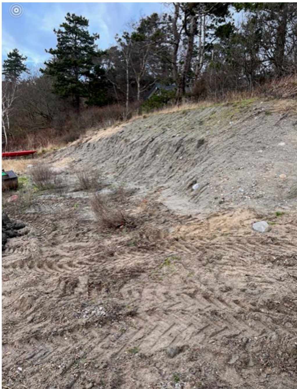
Figur 5 Foto fra januar 2022 inden påbegyndelse af etablering af skråningsbeskyttelse i henhold til tilladelsen fra kommunen. Det ses, at kompensationssandet der tidligere er lagt ud, nu er borte/roderet, men at skrænten fortsat er intakt.