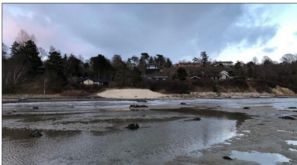
Figur 3: Foto fra marts 2018, der viser den sandbuffer umiddelbart efter dennes etablering.