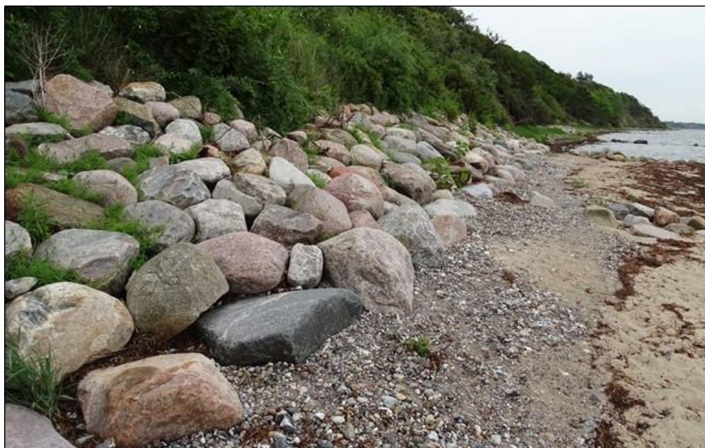
Figur 6: Foto fra 2017 af sikret skræntfod på naboejendom.